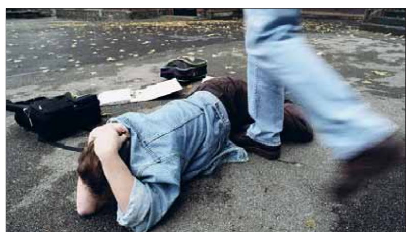
Auf Gewaltkurs: Auch wenn an den Ausschreitungen viele Jugendliche beteiligt waren, glaubt die Polizei nicht an eine Bande.

„Wir stehen erst ganz am Anfang der Ermittlungen“, sagte gestern Harald Wanner, Pressesprecher der Polizeidirektion Ravensburg, die zuständig ist, weil der Großteil der Tatver-